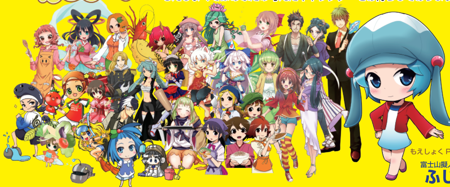
もえしよく PRキャラクター 富士山擬人化 ふじたん